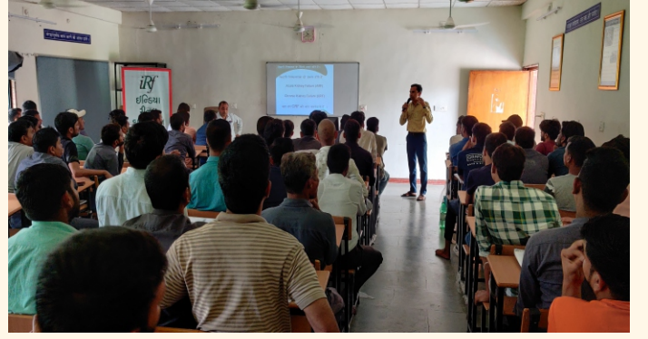
ભારતીય રેલ તાલીમ કેન્દ્ર, અમદાવાદ