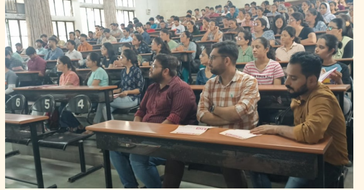
અંગદાન વિષેની માહિતી મેળવતા મેડિકલ કોલેજના વિદ્યાર્થીઓ

રાજકોટ ખાતે અન્ય એક અંગદાન જાગૃતિ કાર્યક્રમ સમરસ ગર્લ્સ હોસ્ટેલની વિદ્યાર્થીનીઓ માટે આયોજીત કરવામાં આવ્યો હતો. જાણીતા નેફ્રોલોજિસ્ટ ડો. મયુર મકાસણા દ્વારા કિડનીના રોગો અને અંગદાન વિશે સરળ ભાષામાં સમજૂતી આપીને દરેક વિદ્યાર્થીનીઓને અંગદાન કરવાનો સંકલ્પ કરાવ્યો હતો.