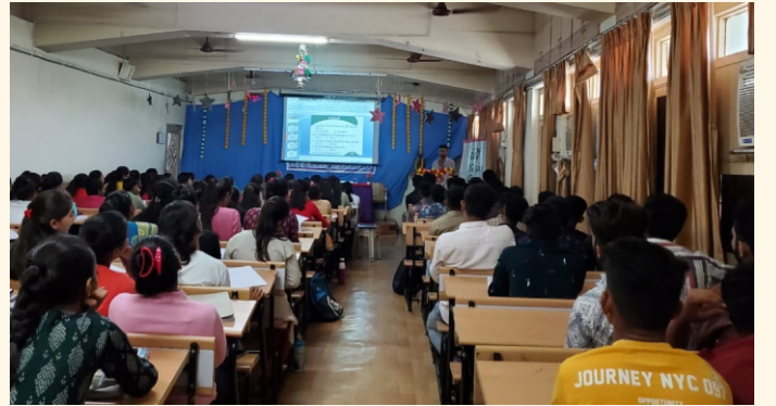
શ્રી સાર્વજનિક એમ. એસ. ડબલ્યુ કોલેજ, મહેસાણા