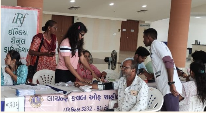
ડૉ. શ્યામા પ્રસાદ મુખર્જી ઓડીટોરિયમ, અમદાવાદ