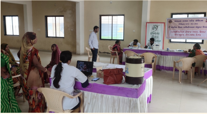
પલસારા ગામ, જી.- ગાંધીનગર