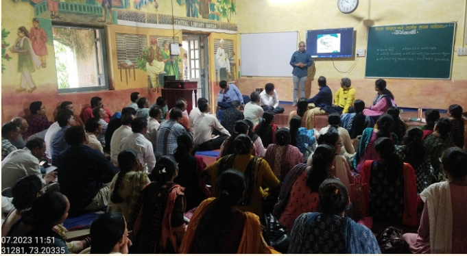
જિલ્લા શિક્ષણ અને તાલીમ કેન્દ્ર, વડોદરા