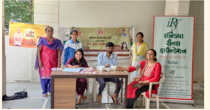
શારદાનગર સોસાયટી, જી.-રાજકોટ