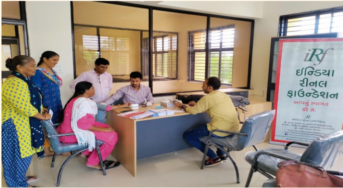
તાલુકા પંચાયત, ગામ-જોટાણા. જી.-મેહસાણા