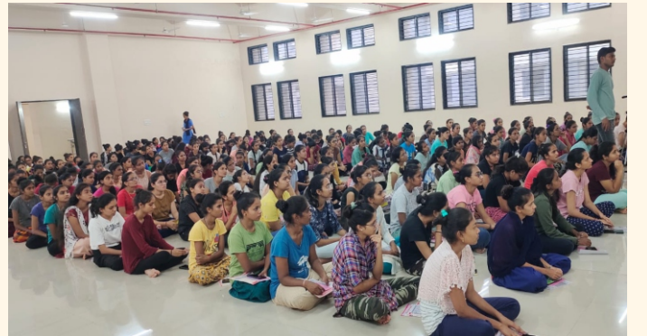
કેડેવરિક અંગદાનની સમજ મેળવતી વિદ્યાર્થીનીઓ