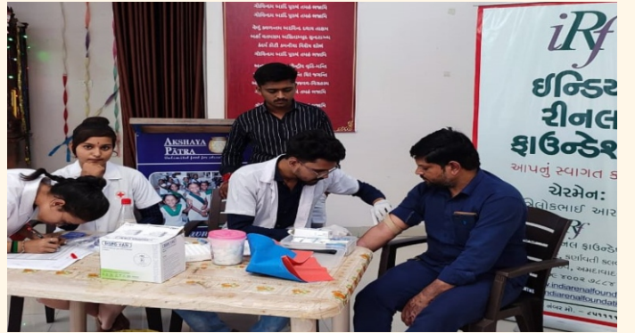
અક્ષયપાત્ર ફાઉન્ડેશન, ભાવનગર