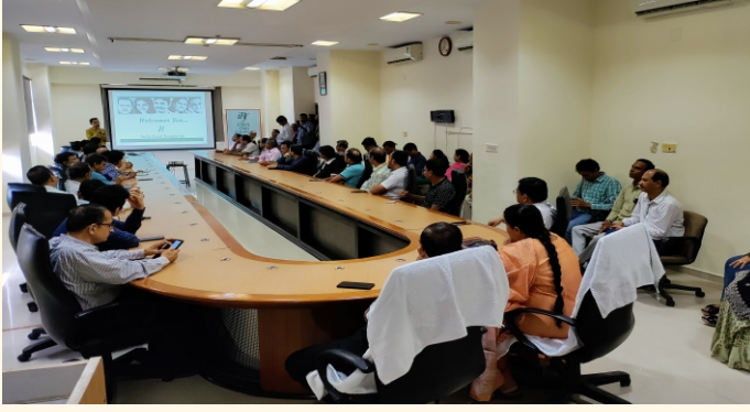
બી.એસ.એન.એલ હેડ ઓફિસ, અમદાવાદ