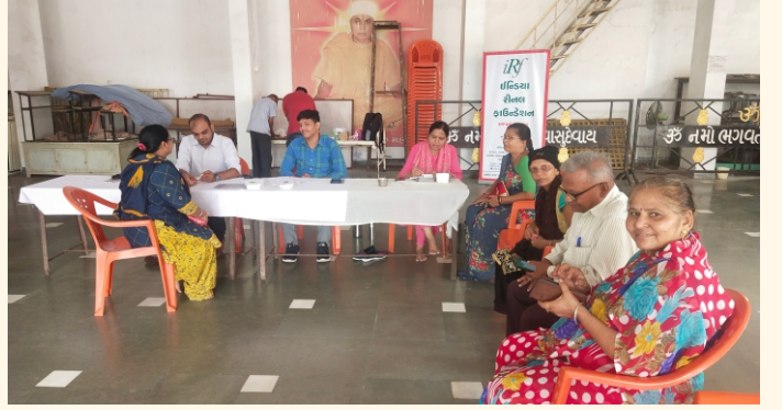
સંતરામ મંદિર, વડોદરા