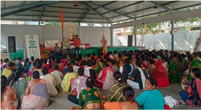
મહેશ્વરી સોસાયટી, રાજકોટ