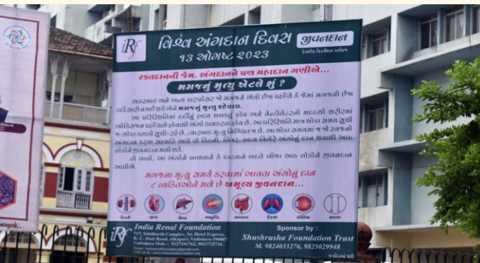
અંગદાન જાગૃતિ હોર્ડિંગ્સ

વડોદરા શહેરના વ્યસ્ત ચાર રસ્તાઓ પર કેટેવર અંગદાન વિષેની માહિતી આપતા હોર્ડિંગ્સ રાખીને શહેરીજનોને કેટેવરિક અંગદાન વિષે સભાન અને જાગૃત કરવાનો એક પ્રયાસ કરવામાં આવ્યો હતો.