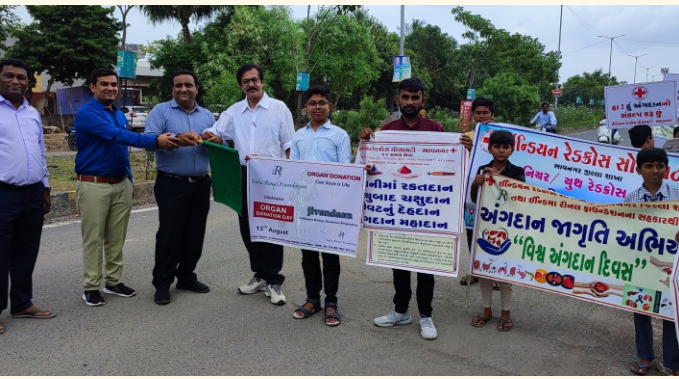
અંગદાન જાગૃતિ રેલી

આ ઉપરાંત રેડક્રોસ સોસાયટીના સહયોગથી તેજસ્વી સ્કૂલ, ભાવનગર ખાતે ચિત્રસ્પર્ધા અને અંગદાન જાગૃતિ રેલીનું આયોજન કરીને આ દિવસની ઉજવણી કરવામાં આવી હતી. આ રેલી મારફતે લોકોમાં અંગદાન જાગૃતિ સંદેશ પાઠવવામાં આવ્યો અને અંગદાન વિષે જાગૃતિ લાવવાનો નમ્ર પ્રયાસ કરવામાં આવ્યો હતો.