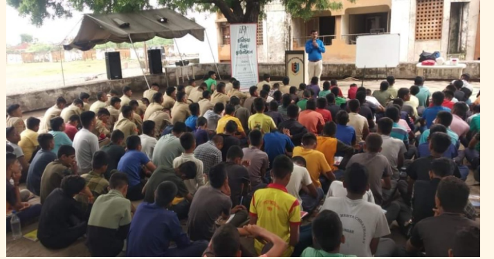
એન. સી. સી., ભાવનગર